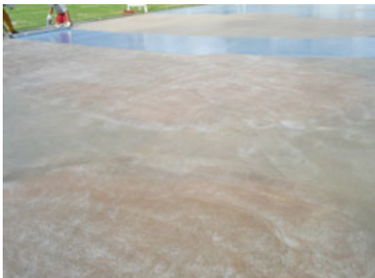
TC-302 - Lixado