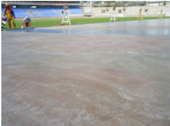
TC-302 - Lixado