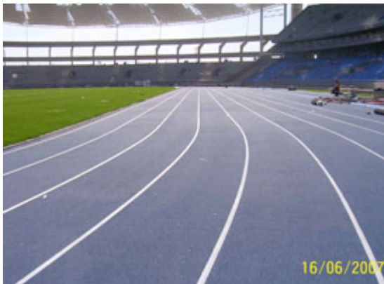
Pista de Atletismo