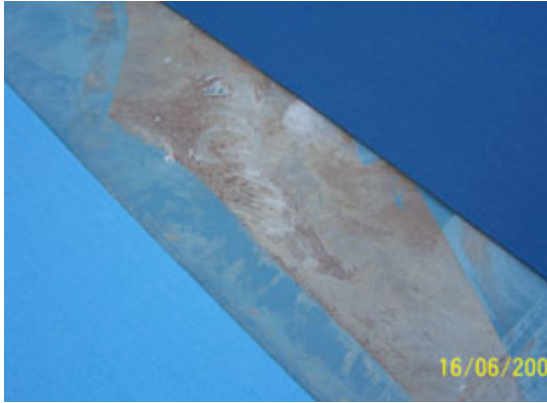
TC-302 + Primer PU + Pista PU